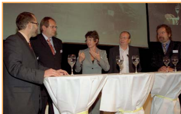
Die Talkrunde zum Thema „Gesunder Genuss“

Der nächste BÄKO-Workshop öffnet am 12. 11. 2006 seine Pforten in Dresden.